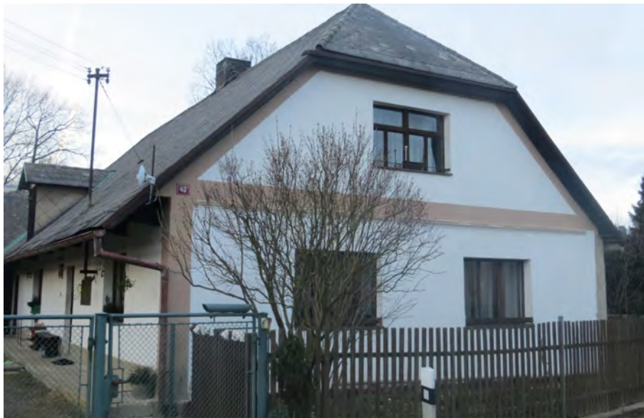
Dům č. p. 42