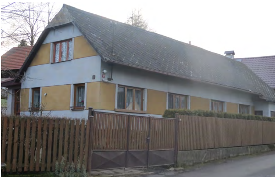
Dům č. p. 43