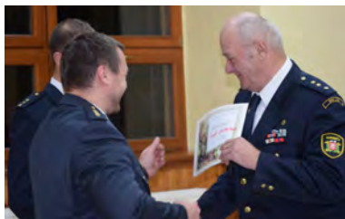
Letošní valná hromada SDH Láz