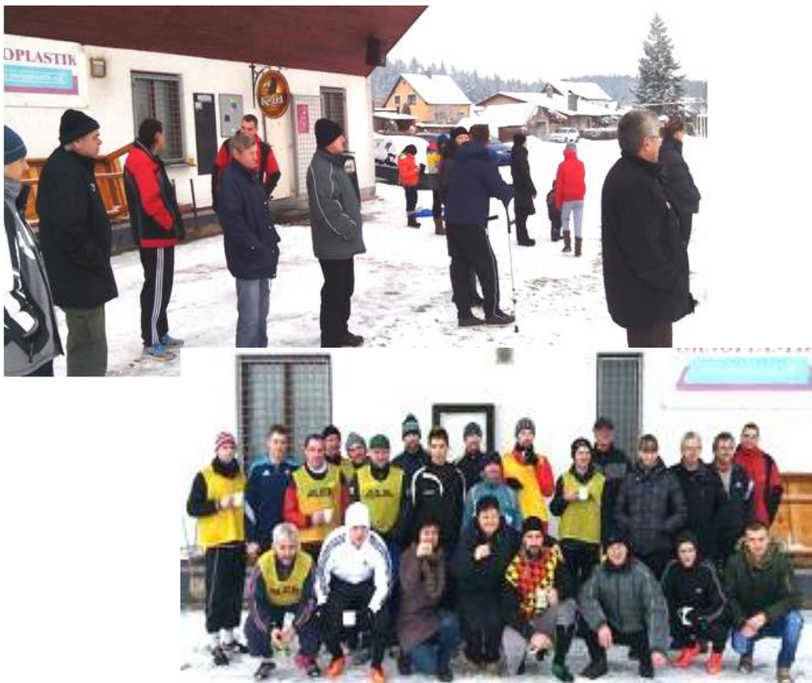
Snímky ze silvestrovského fotbálku