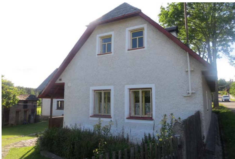
Dům č. p. 45