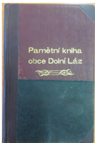
Pamětní kniha obce Dolní Láz 1922 – 1949, obálka knihy

Od příštího čísla Lázských listů bych se chtěla pravidelně vracet prostřednictvím nové rubriky „Střípky z historie Lázu“ zpátky do minulosti a připomínat nejrůznější události ze života naší obce a jejích obyvatel.