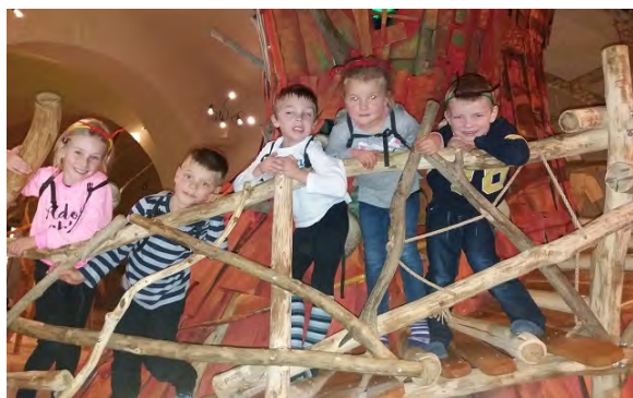
V Písku se nám moc líbilo.