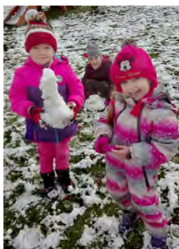
Hurá, první sníh je tu!

činku chodit každé úterý na výtvarný kroužek. V lednu také proběhne schůzka s rodiči ohledně blížící se plánované školy v přírodě, na kterou zveme všechny děti starší 3 let, a na kterou se velmi těšíme.