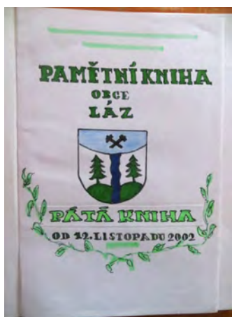
Úvodní strana současné kroniky obce