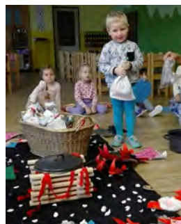
Nadílka od Mikuláše ve školce