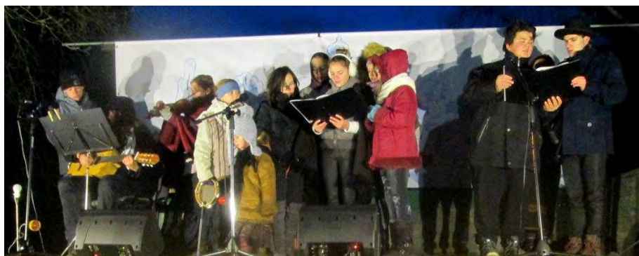
Zahájení Adventu v Tochovicích