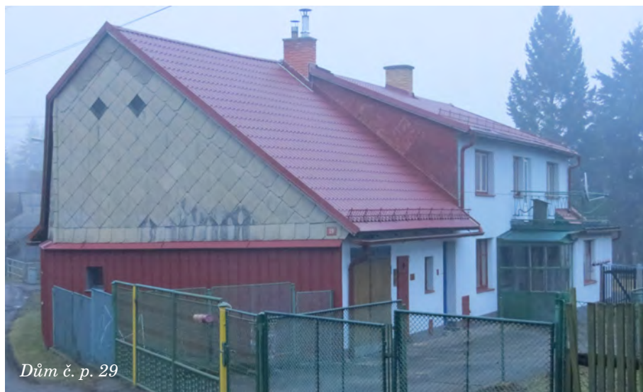
Dům č. p. 29