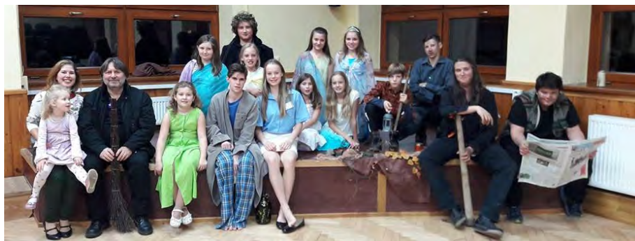
Znovuuvedení hry „Tam, kde končí tma“ v Lázu

24. února 2018 jsme pozváni do Nového Podlesí na první ročník festivalu divadla a hudby KOMÍN 2018.