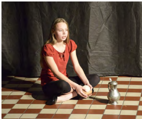
Noc divadel 2017

18. listopadu jsme dostali nabídku zúčastnit se divadelní přehlídky v rámci celosvětového happeningu NOC DIVADEL 2017. Mladí herci si tak vyzkoušeli nové prostředí, tentokrát v prostorách Malého svatohorského divadélka Gymnázia pod Svatou Horou. 24. listopadu proběhlo znovuuvedení hry Tam, kde končí tma. Na její pokračování se můžete těšit koncem ledna 2018.