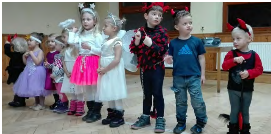
Vystoupení na mikulášské nadílce

V prosinci děti vystupovaly na mikulášské besídce v sále. S rodiči jsme strávili hezké odpoledne při vánočním tvoření a při slavení Vánoc ve školce, kde jsme si zazpívali koledy a rozdávali dárečky, které děti vyrobily rodičům.