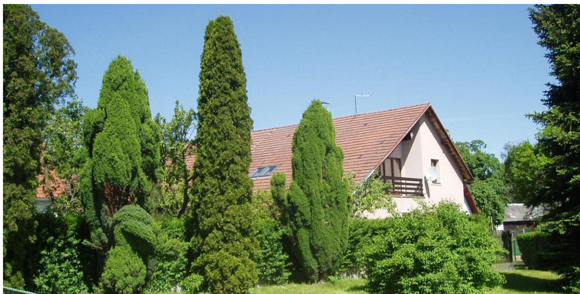
Láz č.p. 6